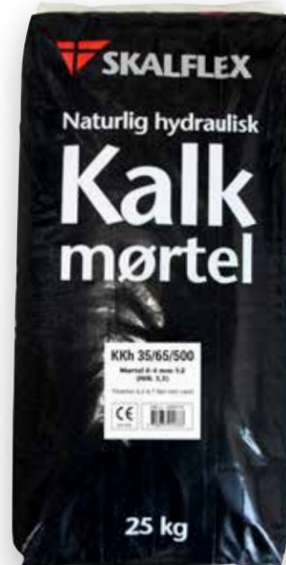
25 kg DB-nr. 1900773